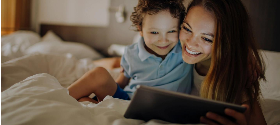
Rundum-Wohlfühlcharakter dank Kombination aus HIBOX Smartroom und SAMSUNG Guest Tablet